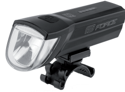
ライト本体+ブラケット